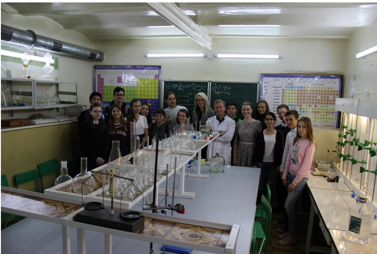
Мастер-класс по химии