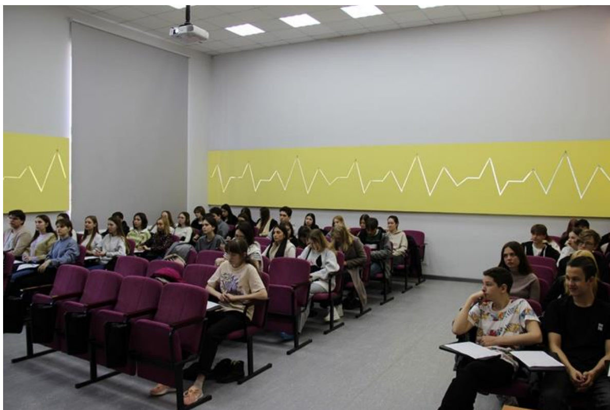
Просветительская акция «Тотальный диктант» на базе филиала СамГТУ в г. Белебее.