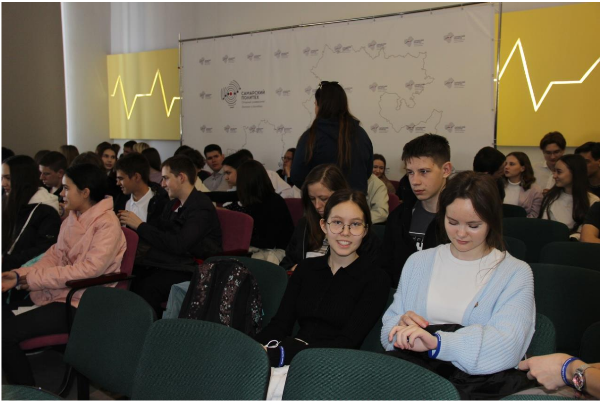
День открытых дверей