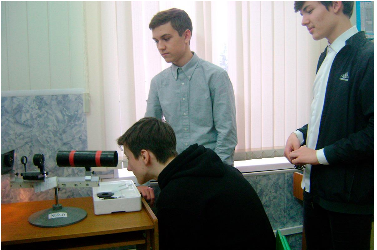
Мастер-класс по физике