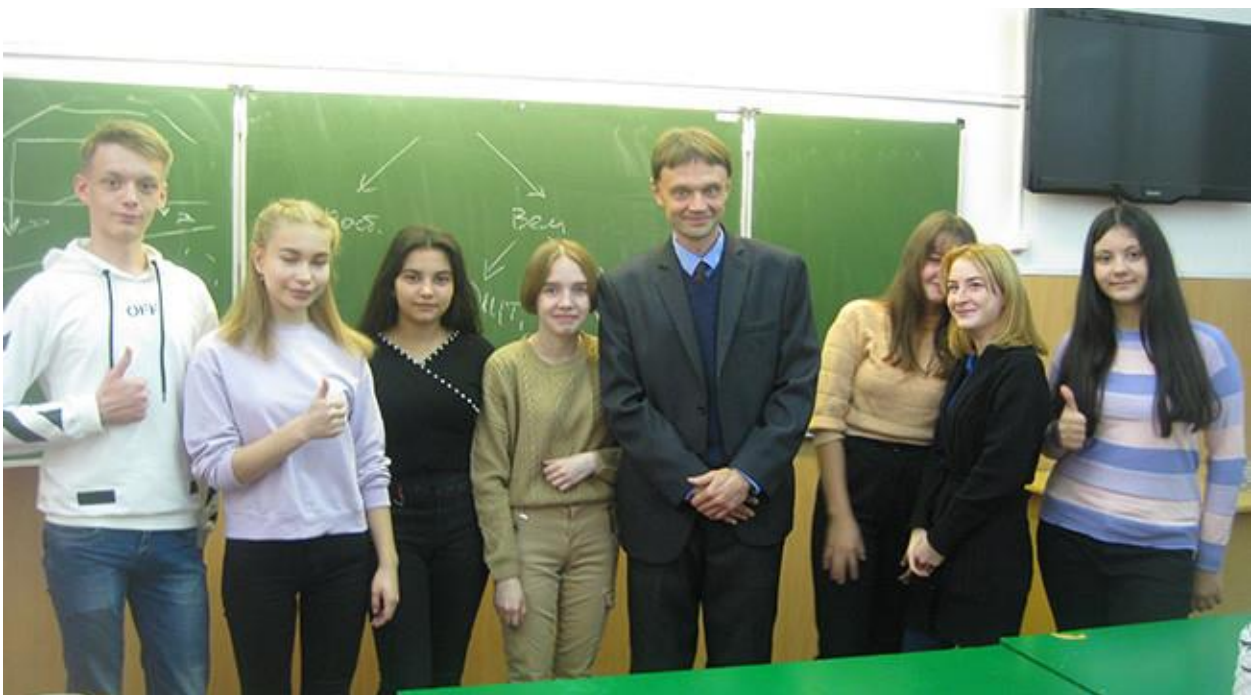
«Школа юного строителя»