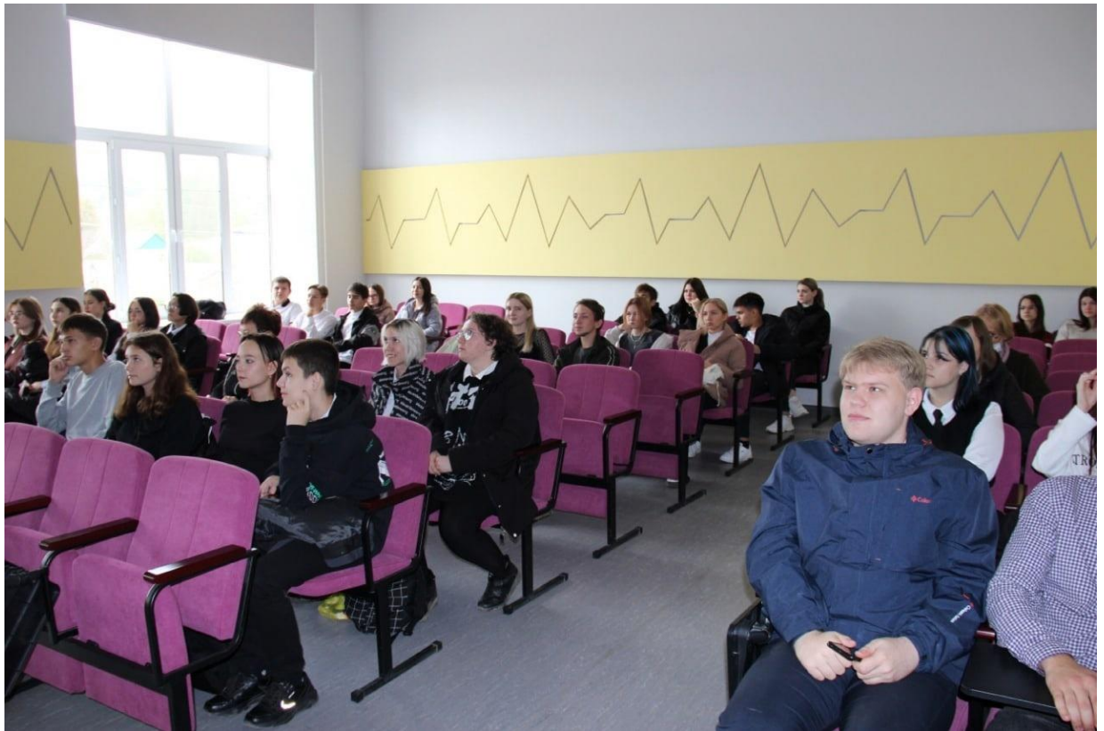
Семинар по бизнес-планированию и основам предпринимательской деятельности