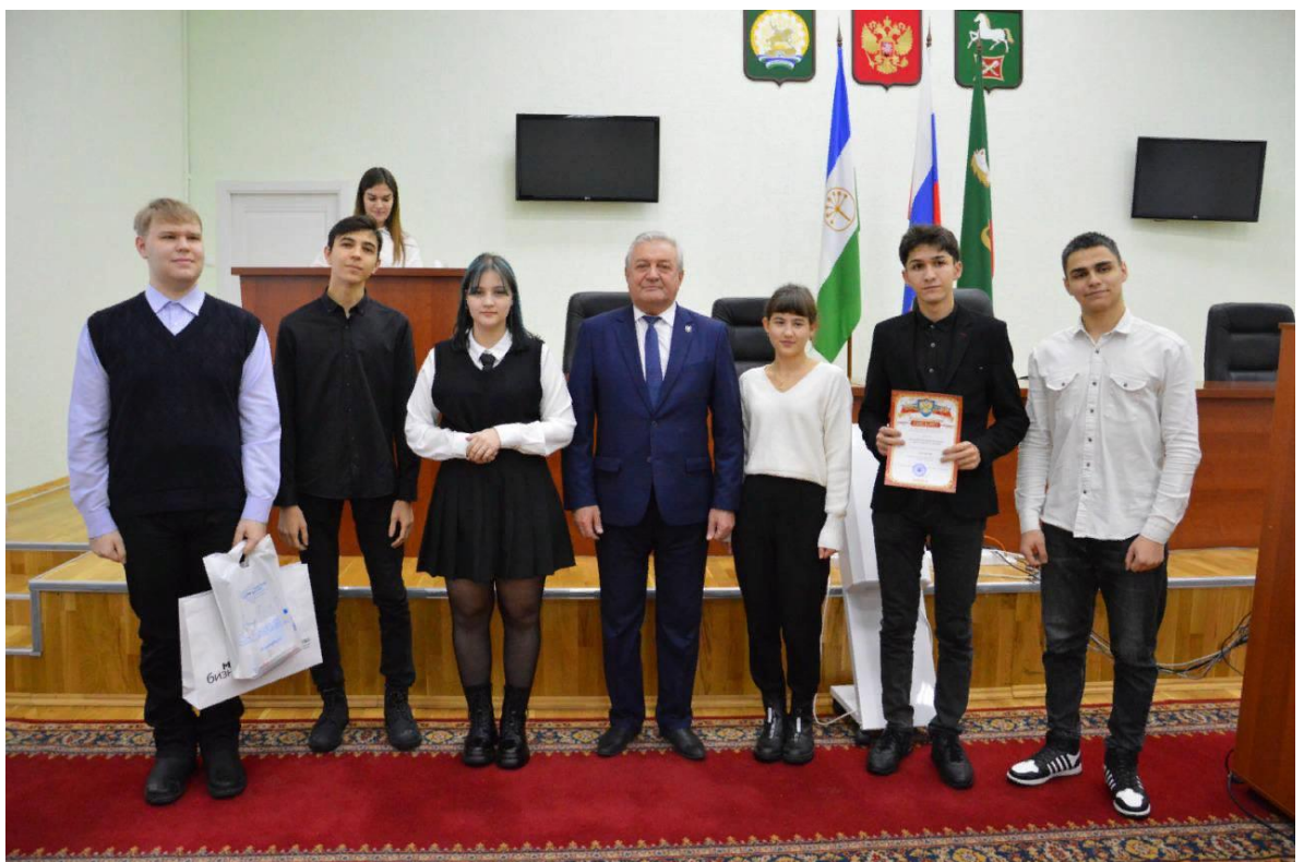
Участие в конкурсе проектов «Думай о будущем»