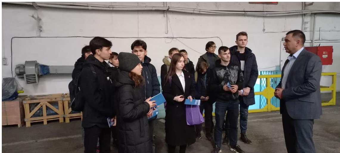
Посещение Научно-Производственного Предприятия «АММА»