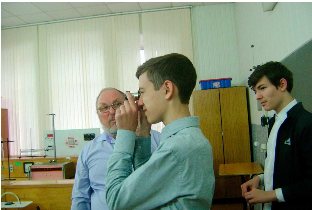
Мастер-класс по физике