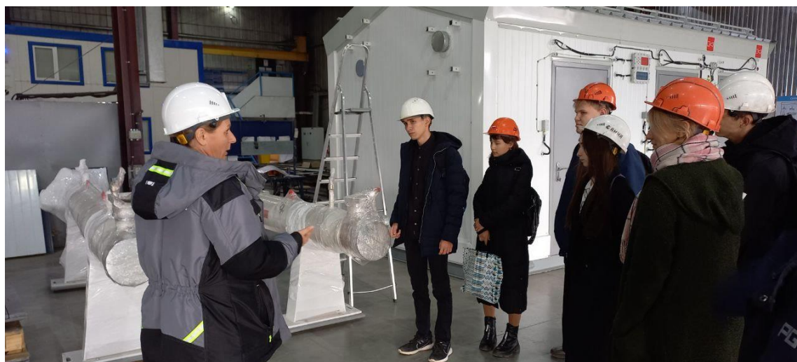
Экскурсия на ООО «Белмашзавод»