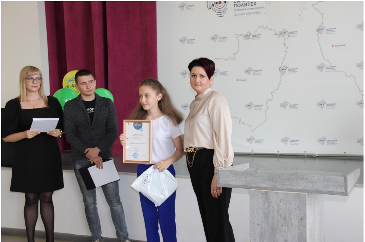
Награждение по итогам XXXI Межрегиональной олимпиады школьников по математике «САММАТ»