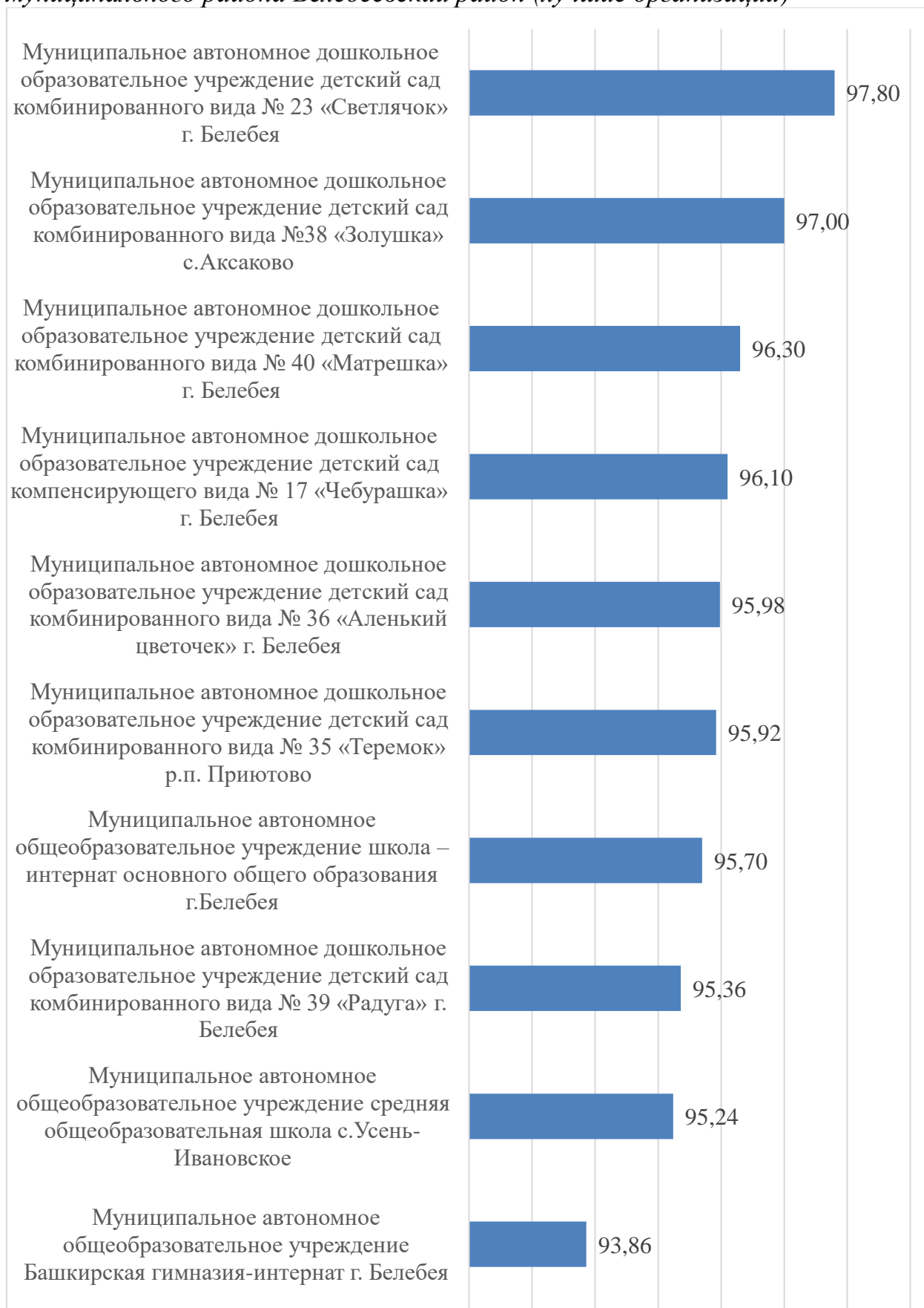
Гистограмма 1. Итоговый рейтинг по результатам сбора, обобщения и анализа информации о качестве условий оказания услуг организациями, осуществляющими образовательную деятельность на территории муниципального района Белебеевский район (лучшие организации)